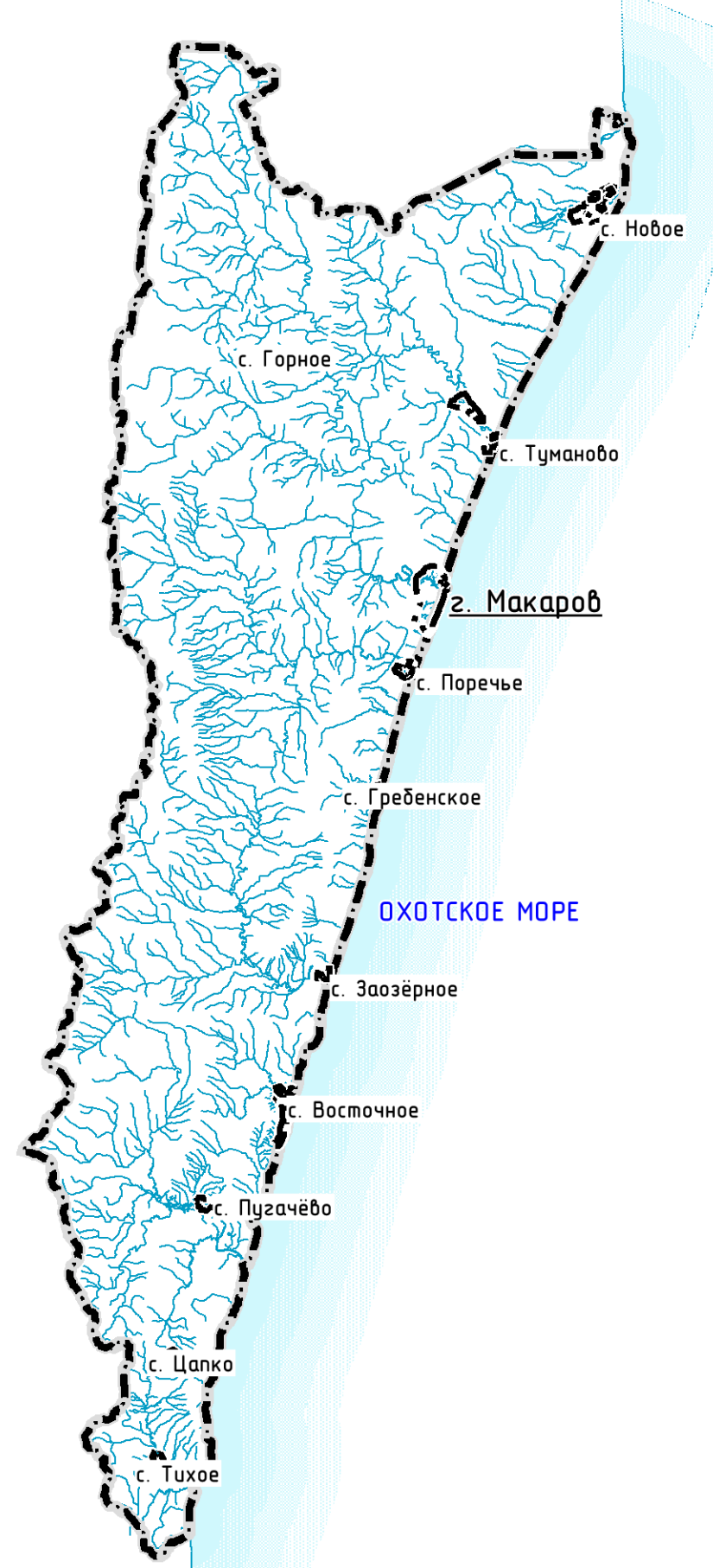
СИТУАЦИОННАЯ СХЕМА М 1:500 000

Примечание - на территории с. Восточное особо охраняемые природные территории отсутствуют.